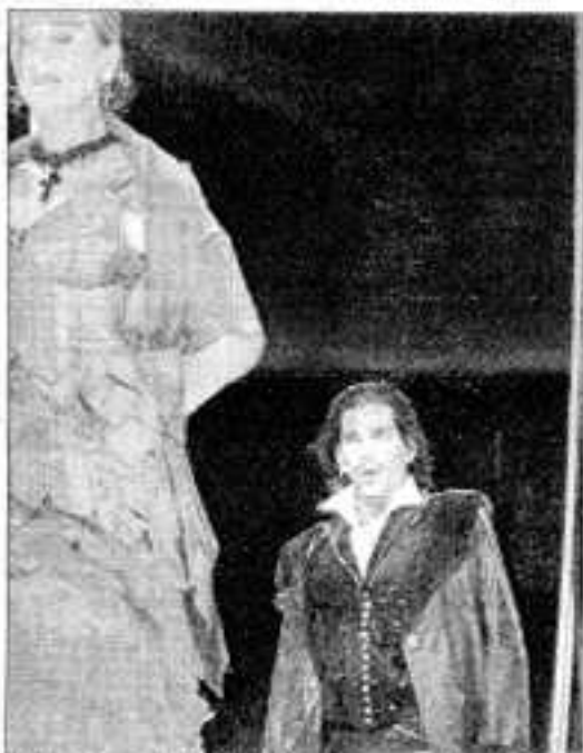
Opéra de rue qui joue avec les mythes... quand Carmen rencontre Roméo